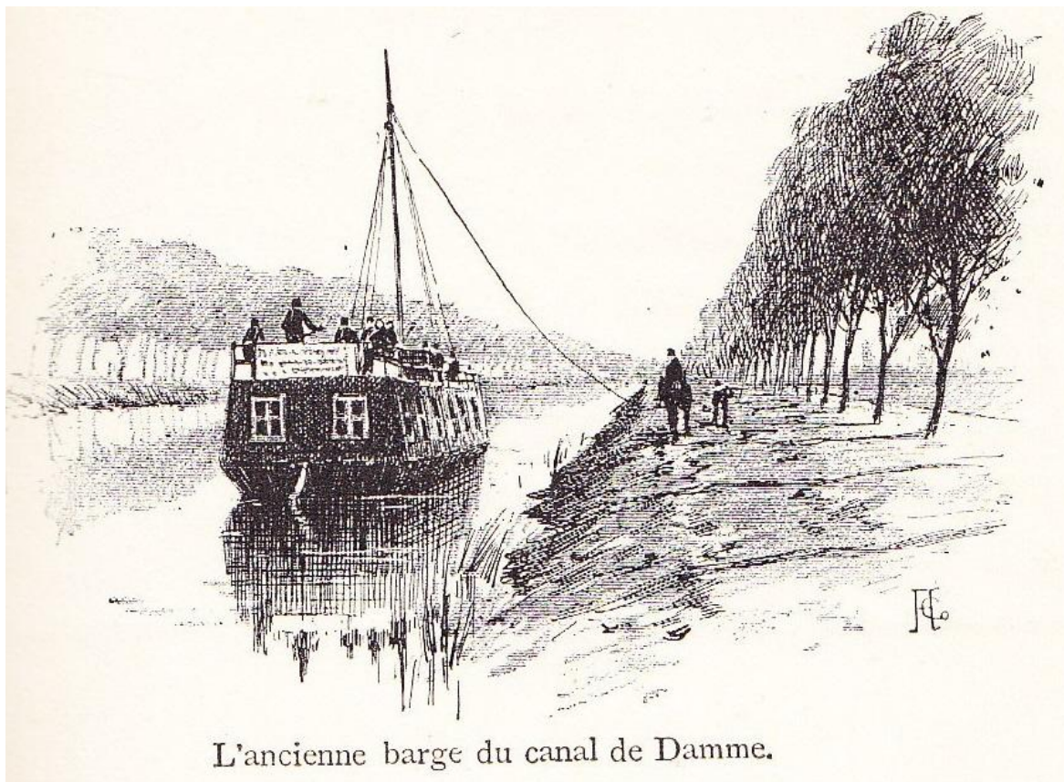
L'ancienne barge du canal de Damme.

à la page 333 de Jean D'ARDENNE , De Dunkerque à Dombourg (1888).